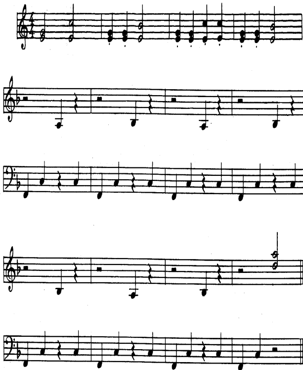
Рис. 1 Один з тих нотних текстів, на яких проводилось тестування.